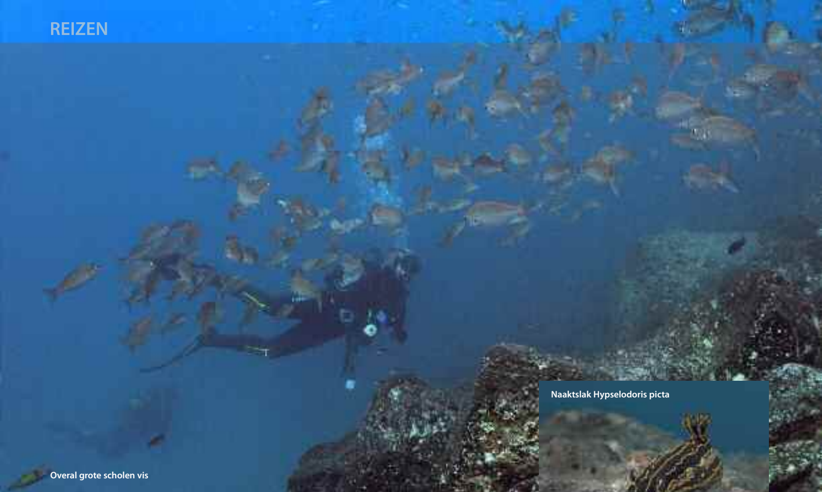
Overall grote scholen vis

het schijnsel van de lamp op, net als bij krokodillen. Ze waren heel dicht te benaderen en te zien was dat het beide mannetjes waren. Ze hebben twee 'claspers' onderaan de buik, die ze overigens niet tegelijk gebruiken.