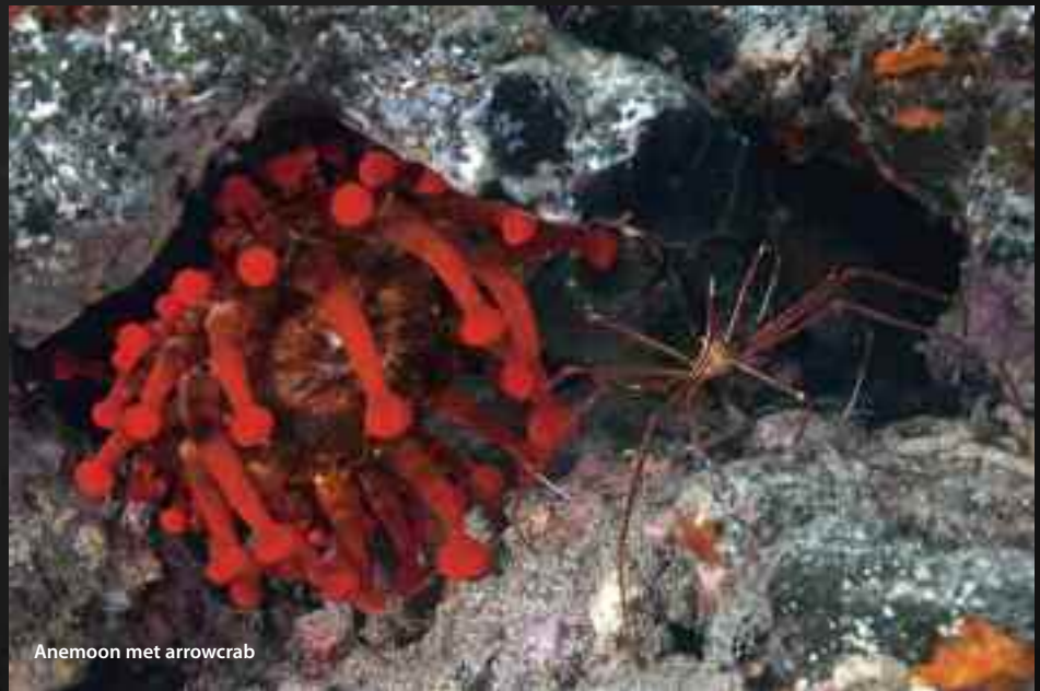
Anemoon met arrowcrab