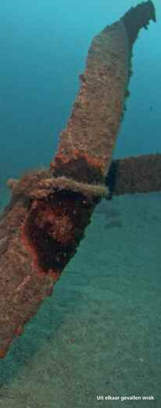
Uit elkaar gevallen wrak